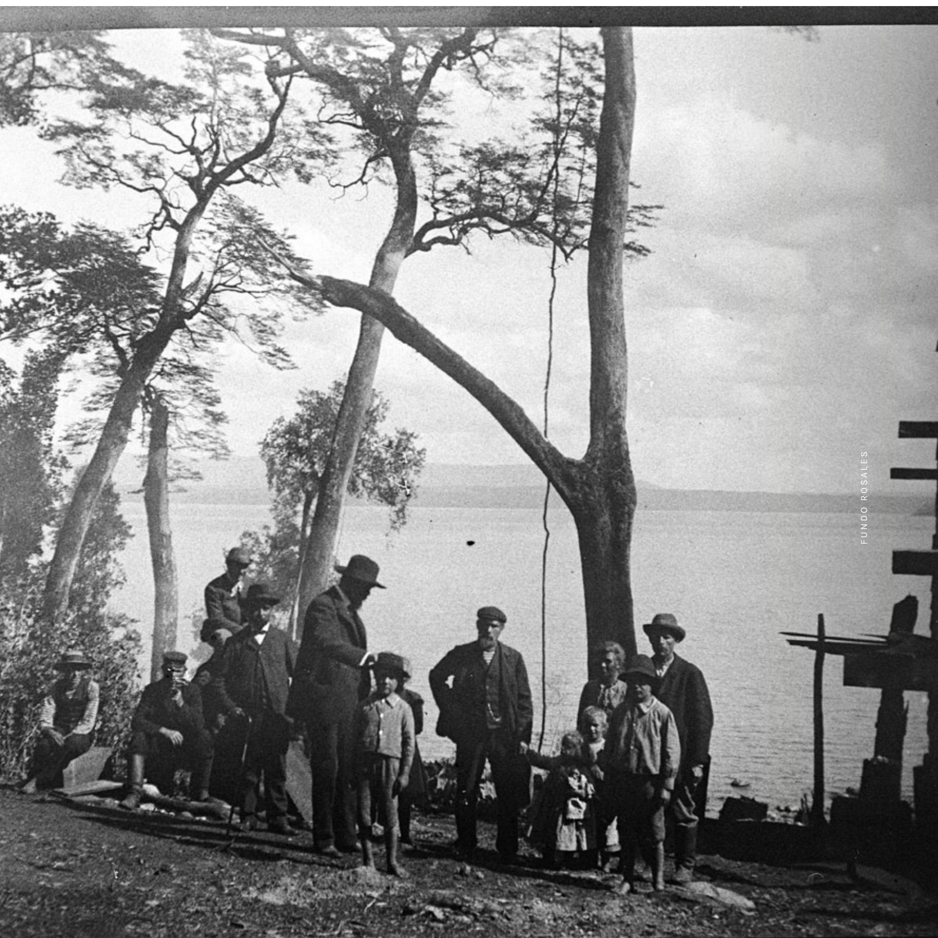
Colonos a orillas del lago Llanquihue c. 1860.