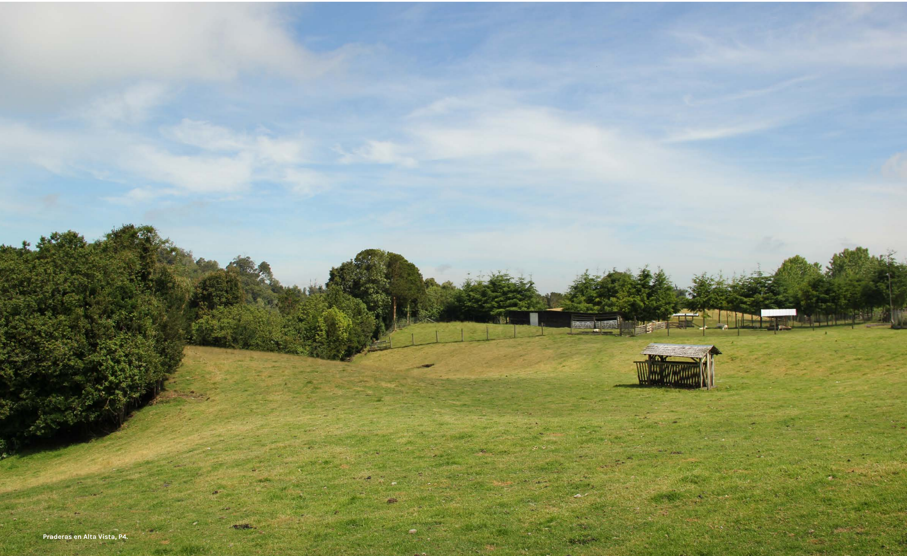
Praderas en Alta Vista, P4.