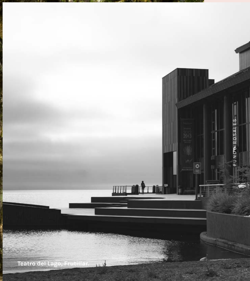
Teatro del Lago, Frutillar.

Escucha un concierto en Frutillar, disfruta de los mejores restaurantes de Puerto Varas y descubre las rutas de trekking y esquí del volcán Osorno.