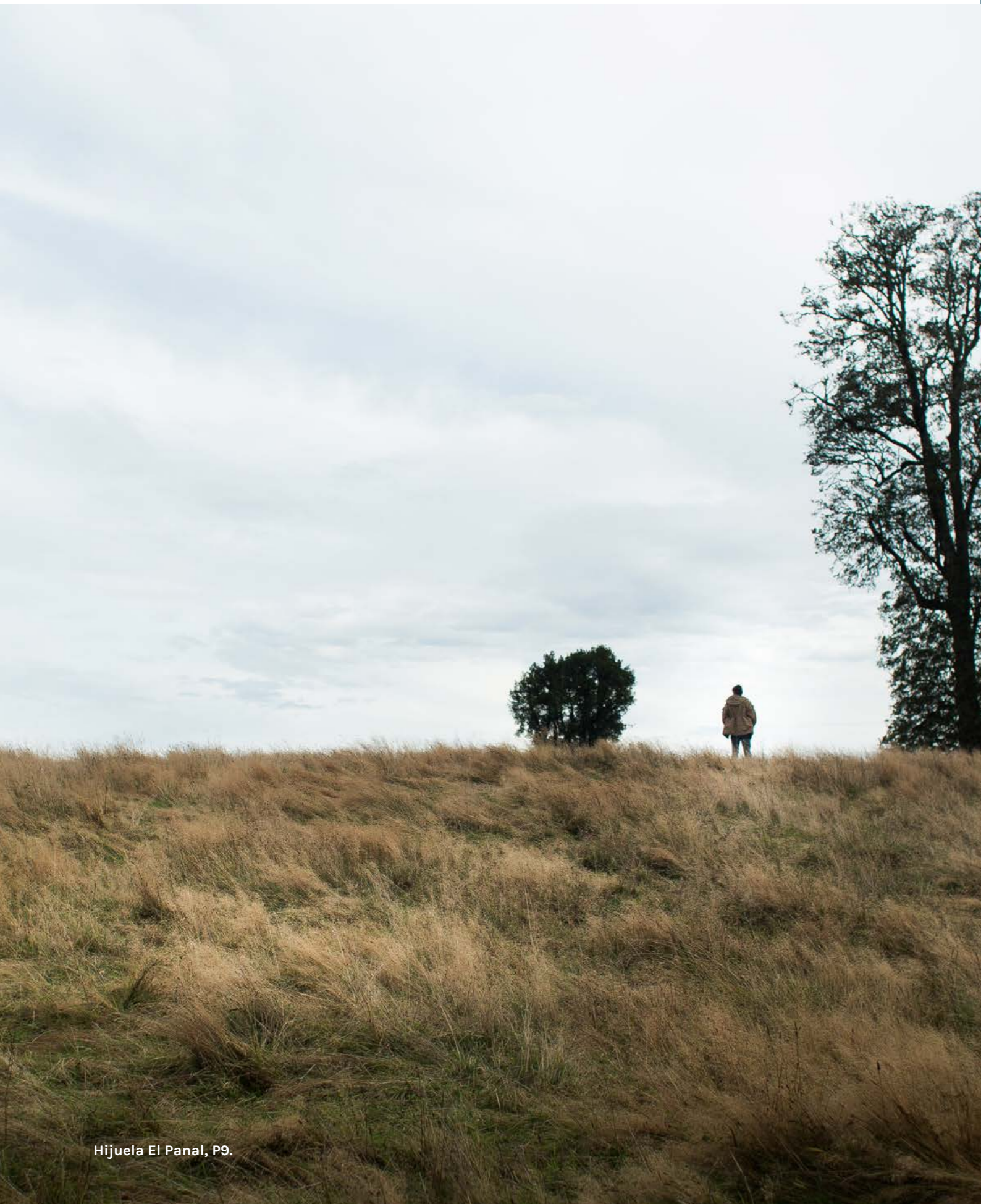
Hijuela El Panal, P9.