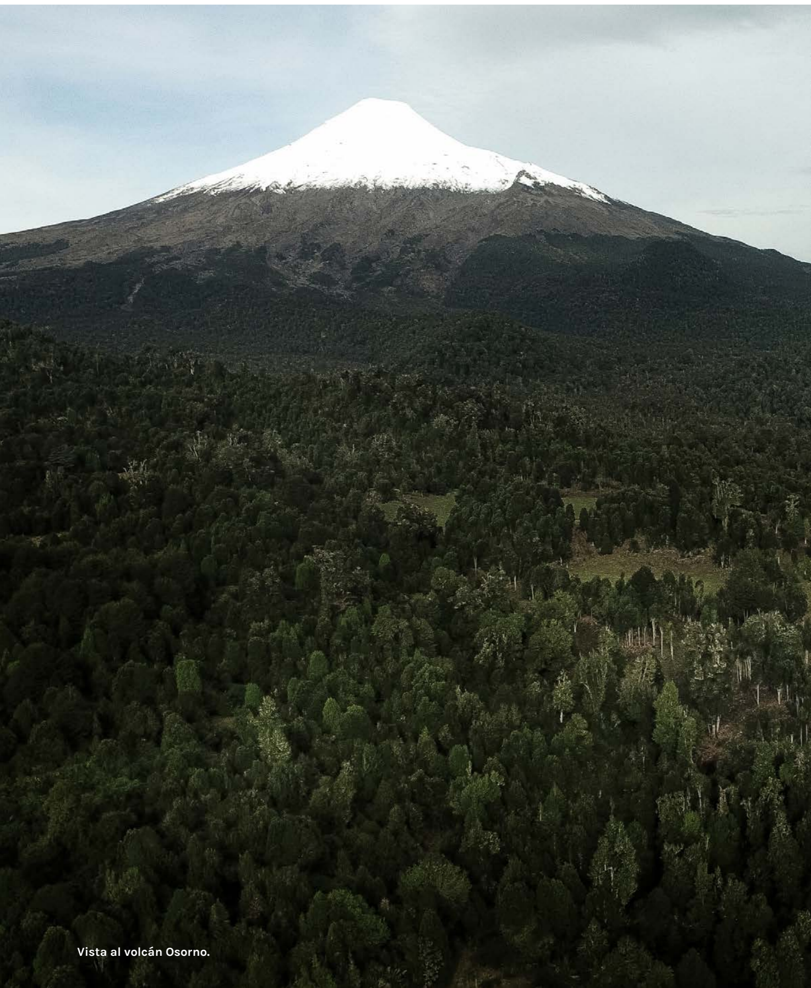
Vista al volcán Osorno.

De espíritu libre y en un entorno de paisajes privilegiados, marcados por la naturaleza y el legado de colonos alemanes,