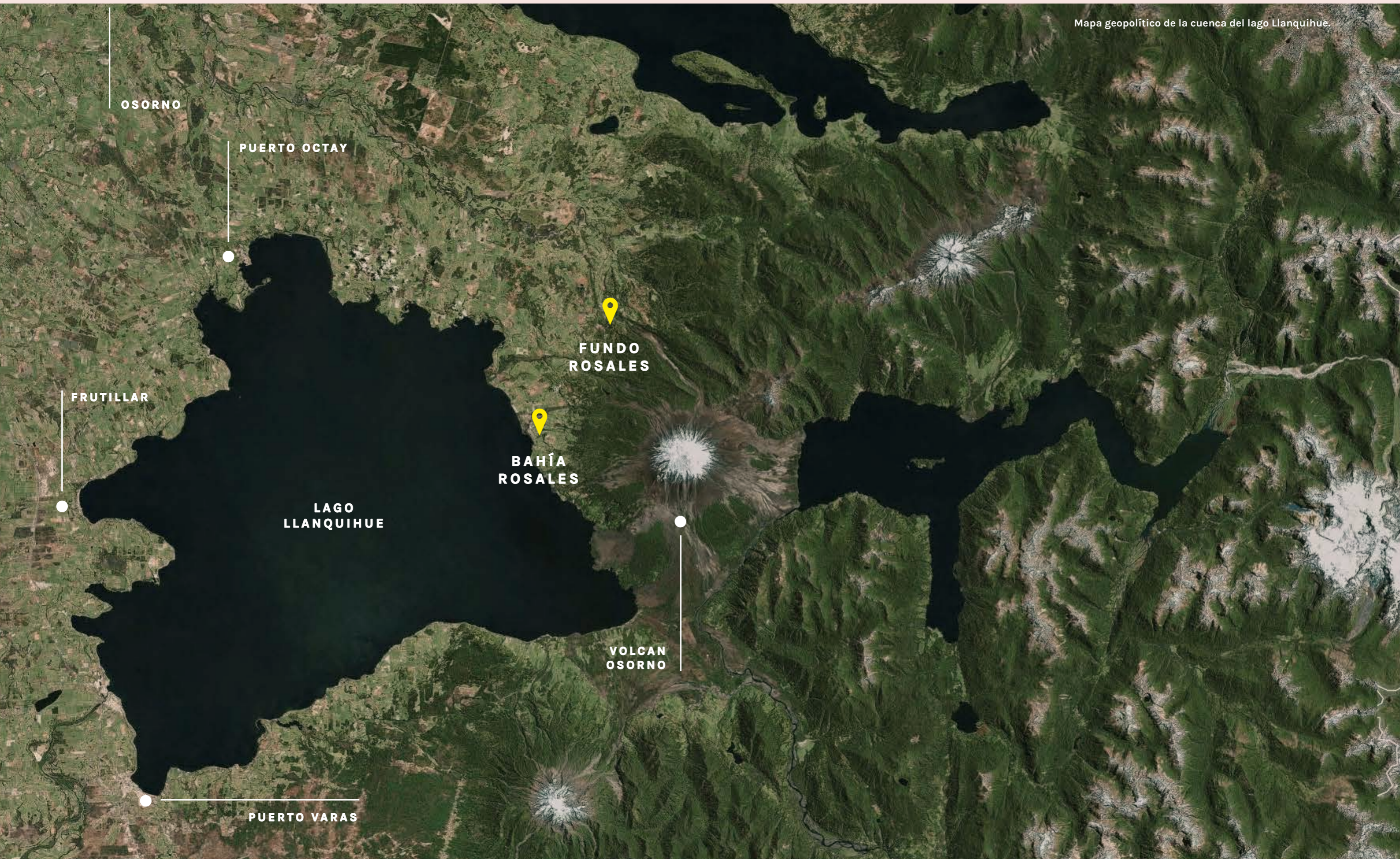
Mapa geopolítico de la cuenca del lago Llanquihue.