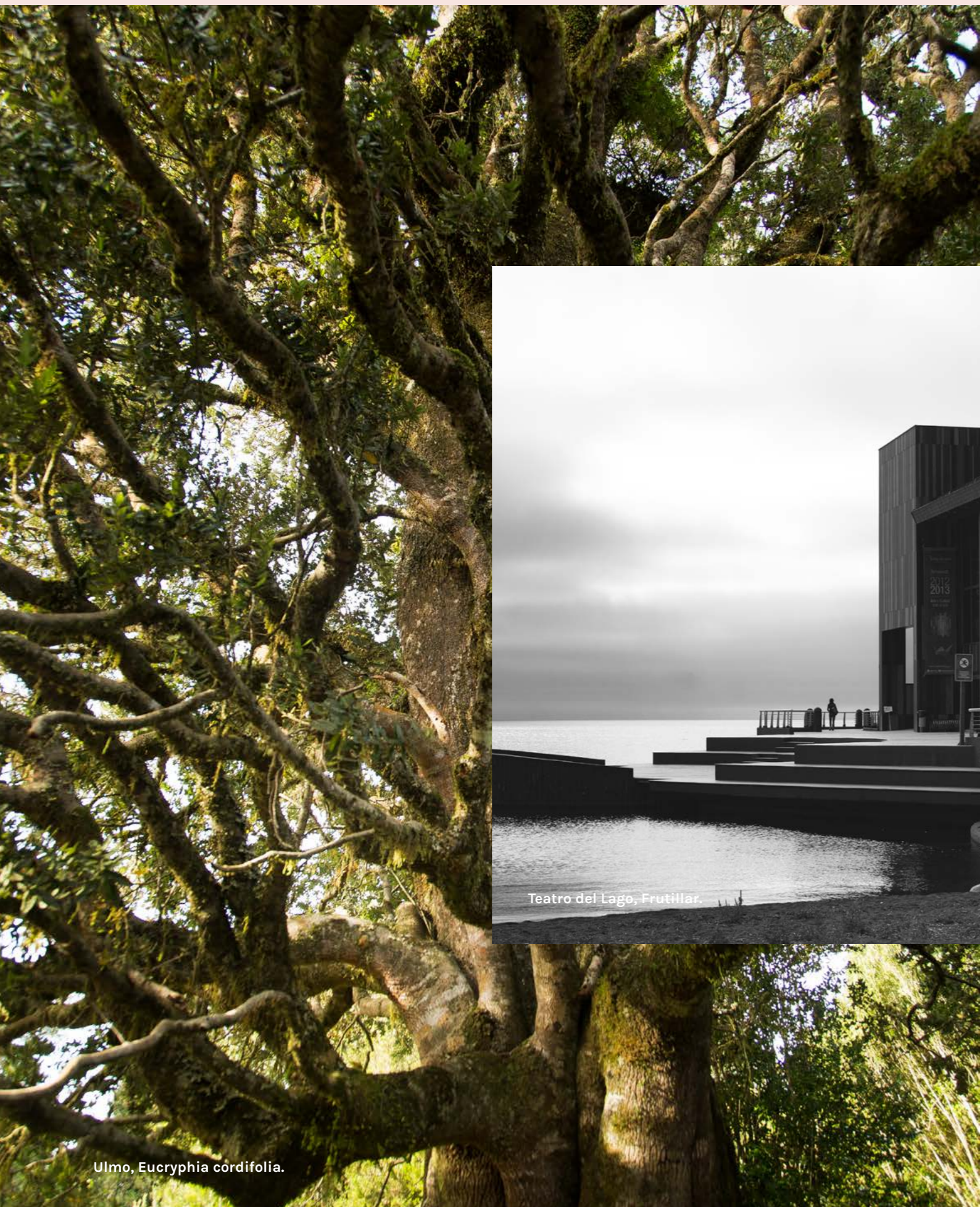
Ulmo, Eucryphia cordifolia .